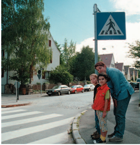
Le comportement adéquat à adopter auprès des passages piétons s'apprend.