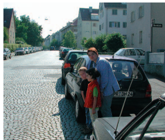
Soyez vigilants en traversant derrière des véhicules en stationnement !

Herausgeberin: Landeshauptstadt Stuttgart, Amt für öffentliche Ordnung, Straßenverkehrsangelegenheiten, Schulverwaltungsamt in Verbindung mit der Abteilung Kommunikation, und dem Polizeipräsidium Stuttgart; Text: Hans Böhm; Grafik: Uli Schellenberger; Kartengrundlage: Stadtmessungsamt