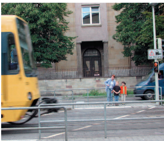
Stop – le tramway est prioritaire !

Le signe de l'action Gute Fee (La bonne fée) indique la présence d'une aide proposée aux enfants. Les détaillants, les commerçants, les institutions sociales et les conductrices et conducteurs de l'entreprise Stuttgarter Straßenbahnen AG proposent leur aide comme soutien et interlocuteurs pour les enfants.