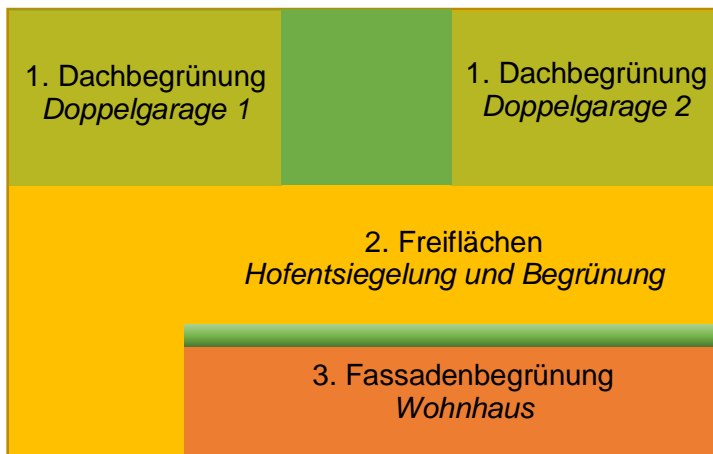
Abb. 2 Beispielrechnung förderfähige Maßnahmen