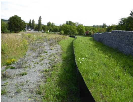
Abbildung 4: Reptilienschutzzaun