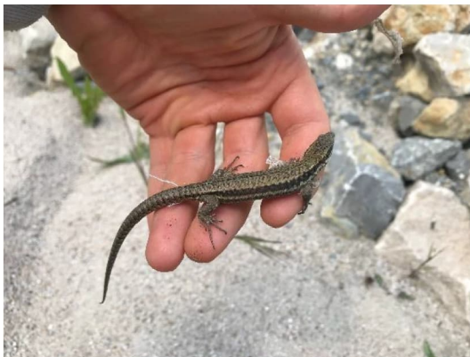
Abbildung 6: Umgesetzte weibliche Mauereidechse