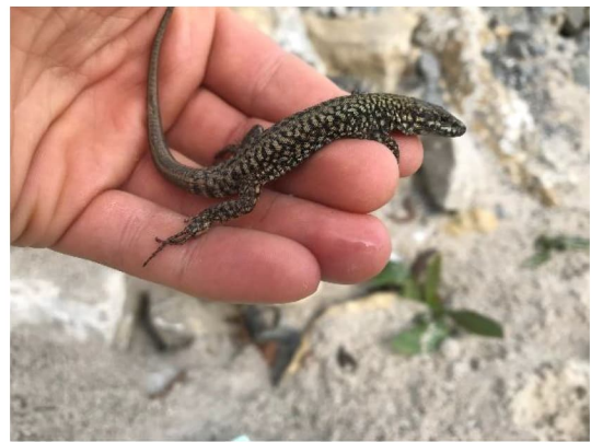
Abbildung 5: Umgesetzte männliche Mauereidechse