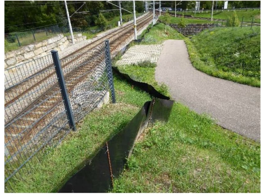
Abbildung 3: Reptilienschutzzaun