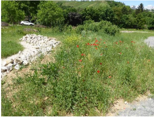
Abbildung 2: Zustand der Ausgleichsfläche zu Beginn der Umsetzung