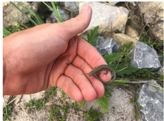
Abbildung 7: Umgesetzte juvenile Mauereidechse